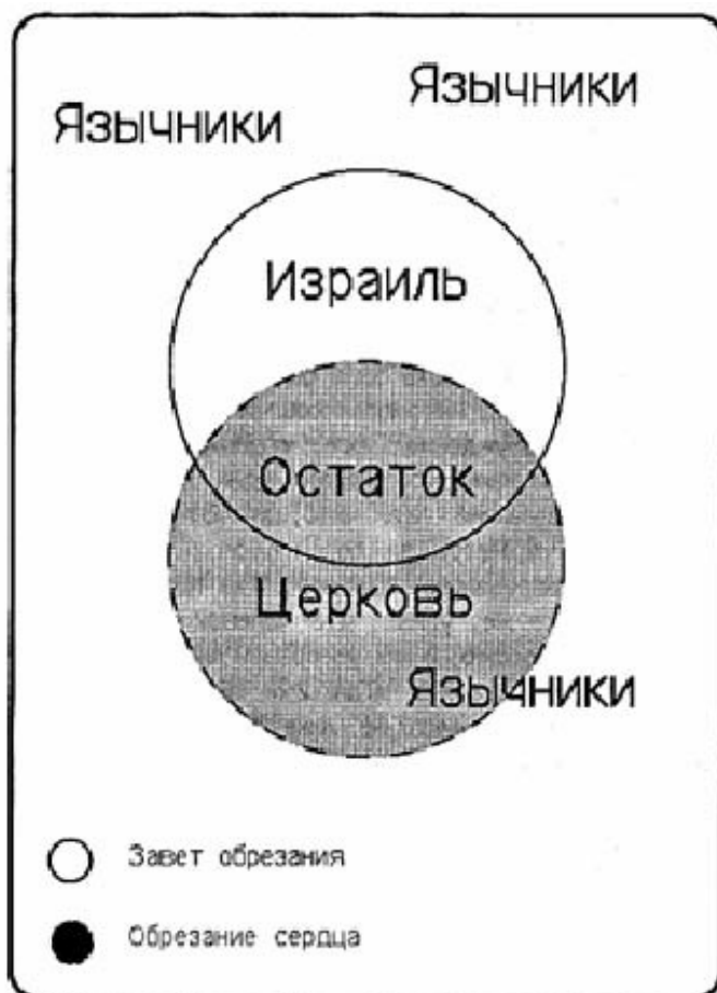
Диаграмма 3: Язычники, Евреи, Остаток и Церковь

Физически они такие же, как и их неверующие братья, различие заключается в обрезании сердца. Обрезание сердца делает их такими же, как их верующие братья из Евреев, хотя по плоти они отличаются. Неверующие Иудеи и неверующие Язычники отличаются физически, но схожи необрезанием сердец.