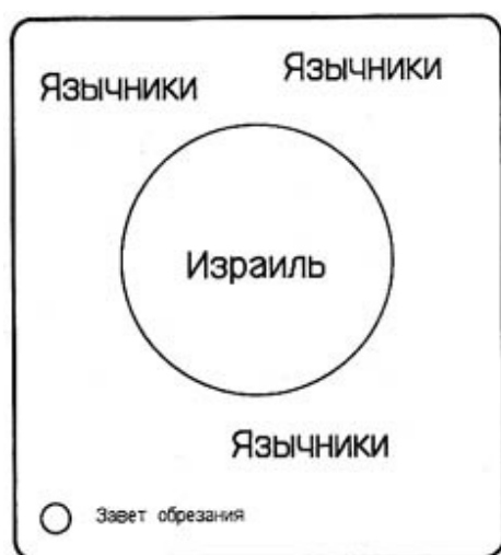
Диаграмма 1: Язычники и Еврей

"И сказал Господь Авраму: пойдя из земли твоей, от родства твоего и из дома отца твоего, в землю, которую я укажу тебе. И я произведу от тебя великий народ, и благословлю тебя, и возвеличу имя твое, и будешь ты в благословение. Я благословлю благославляющих тебя, и злословящих тебя прокляну; и благословятся в тебе все племена земные". (Быт. 12:1-3)